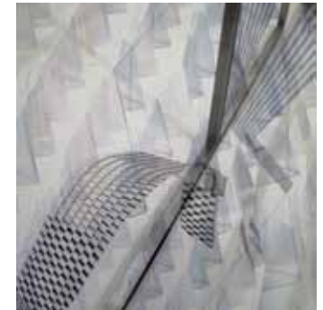
BREZ NASLOVA foto-kolaž, mešana tehnika na aluminij Dibond ploščah 100 × 100 cm, 2017