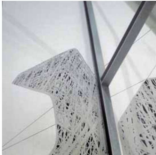
BREZ NASLOVA foto-kolaž, mešana tehnika na aluminij Dibond ploščah 40 × 40 cm, 2016