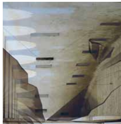
foto-kolaž, mešana tehnika na aluminij Dibond ploščah 100 × 100 cm, 2017