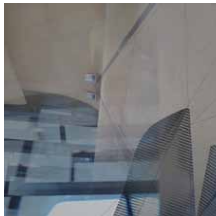
BREZ NASLOVA foto-kolaž, mešana tehnika na aluminij Dibond ploščah 100 × 100 cm, 2017