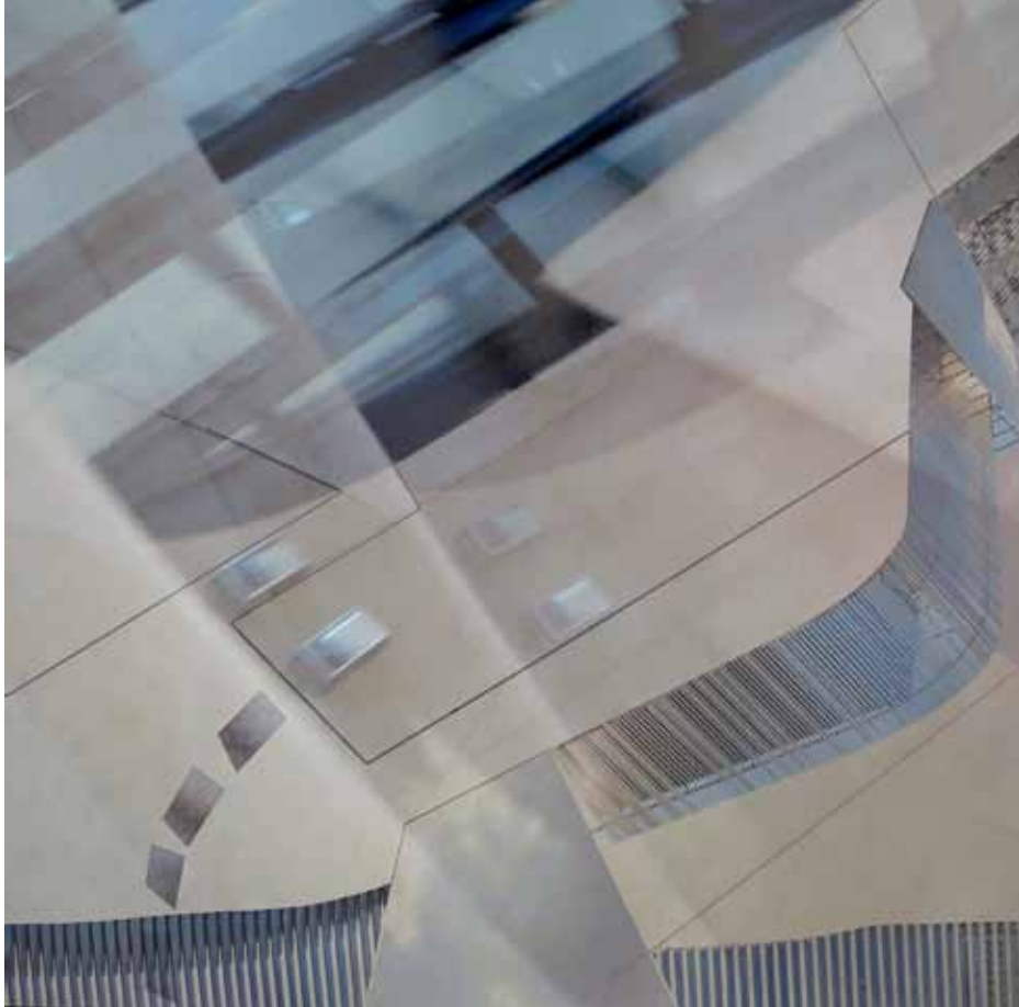
BREZ NASLOVA foto-kolaž, mešana tehnika na aluminij Dibond ploščah 100 × 100 cm, 2017