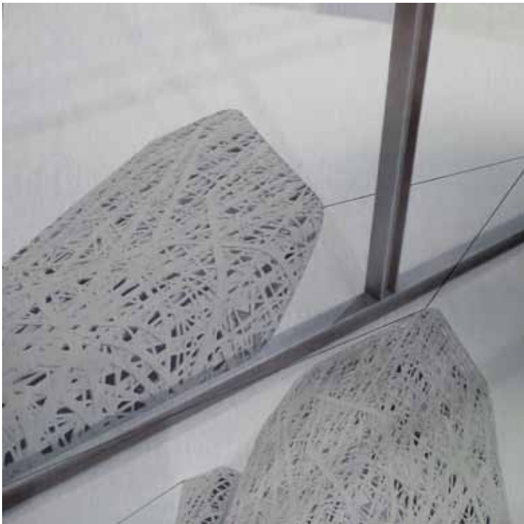
BREZ NASLOVA foto-kolaž, mešana tehnika na aluminij Dibond ploščah 40 × 40 cm, 2016