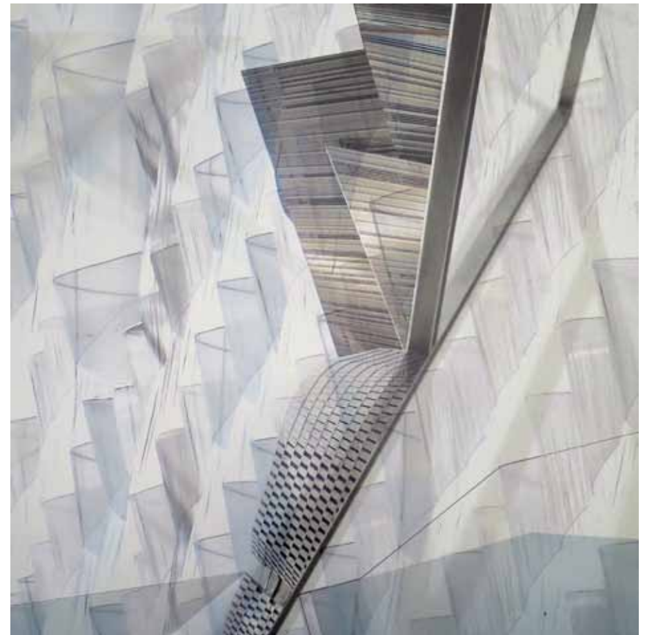
BREZ NASLOVA foto-kolaž, mešana tehnika na aluminij Dibond ploščah 100 × 100 cm, 2017