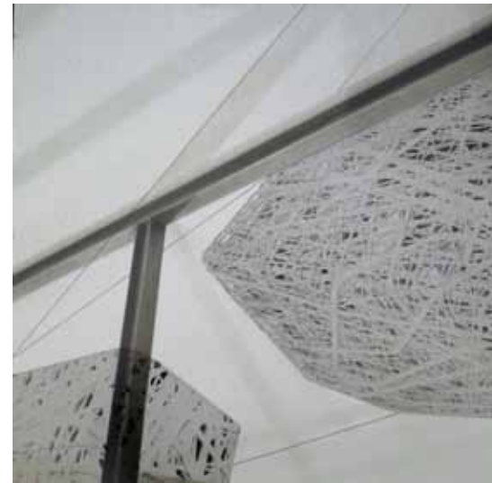
BREZ NASLOVA foto-kolaž, mešana tehnika na aluminij Dibond ploščah 40 × 40 cm, 2016